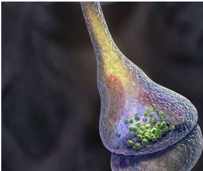
Figure 1 : Synapse

La logique binaire des ordinateurs, aussi performante soit elle, est en revanche à ce jour incapable de raisonner. C'est pourquoi les informaticiens en viennent à utiliser des systèmes à logique floue et auto-évolutive (appliqués aussi bien à l'électroménager qu'aux réseaux neuronaux artificiels) plus aptes à saisir paradoxes et notions de sens commun. Il y a donc des paliers du réel, que le monde du vivant ne transgresse pas, mais au contraire stratifie. Le système nerveux permet ainsi une transmission rapide et hautement structurée des signaux. La communication intercellulaire est réalisée par l'intermédiaire de jonctions synaptiques électriques ( gap junctions ) et surtout chimiques qui seront, selon le médiateur et les perméabilités membranaires en jeu, tantôt excitatrices tantôt inhibitrices.