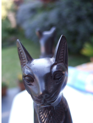
« Le chat de Schrödinger »

temps est déterminé dans notre cerveau par la flèche entropique, alors ces deux lois seraient conciliables et élimineraient le paradoxe temporel apparent.