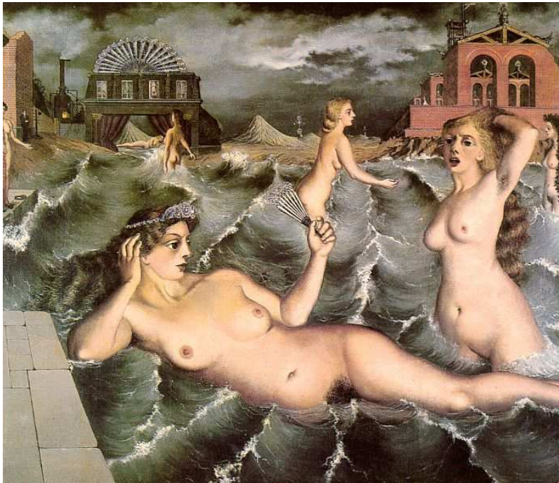
Figure 4 : Le rêve

synaptiques au niveau du cortex cérébral, ce qui aurait pour conséquence d'estomper la trace du rêve inconscient au réveil. Mimés par des réseaux neuronaux, ces approches montrent que l'inversion de la fonction d'apprendre ( reverse learning ) augmente la performance grâce à l'effacement spatial et temporel de certains réseaux qui libèrent de la place dans la mémoire encombrée du cerveau (Hopfield et al., 1983).